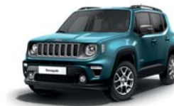
470 Bikini (metalizowany)