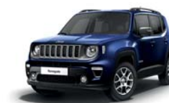
888 Niebieski Jetset (metalizowany)