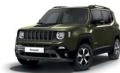
149 Zielony Matt Green (matowy) - tylko wersja Trailhawk