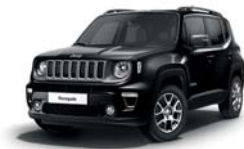
601 Czarny Solid (pastelowy)