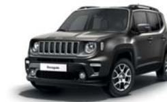
503 Sting Grey (pastelowy)