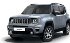
348 Srebrny Glacier (metalizowany)