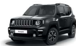
095 Grafitowy Granite Crystal (metalizowany)