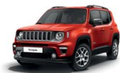
176 Czerwony Colorado (pastelowy)