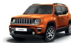
562 Pomarańczowy Omaha (pastelowy)