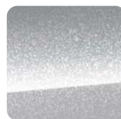
5CH Billet Silver Metaliczny