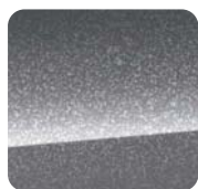
210 Granite Crystal Metaliczny