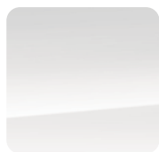
5JQ Bright White