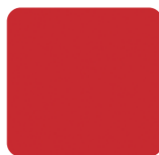
5CF Firecracker Red