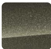
4SA Olive Green Perłowy