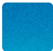
4H5 Hydro Blue Perłowy