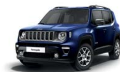
888 Niebieski Jetset (metalizowany)