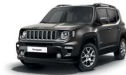
503 Sting Grey (pastelowy)